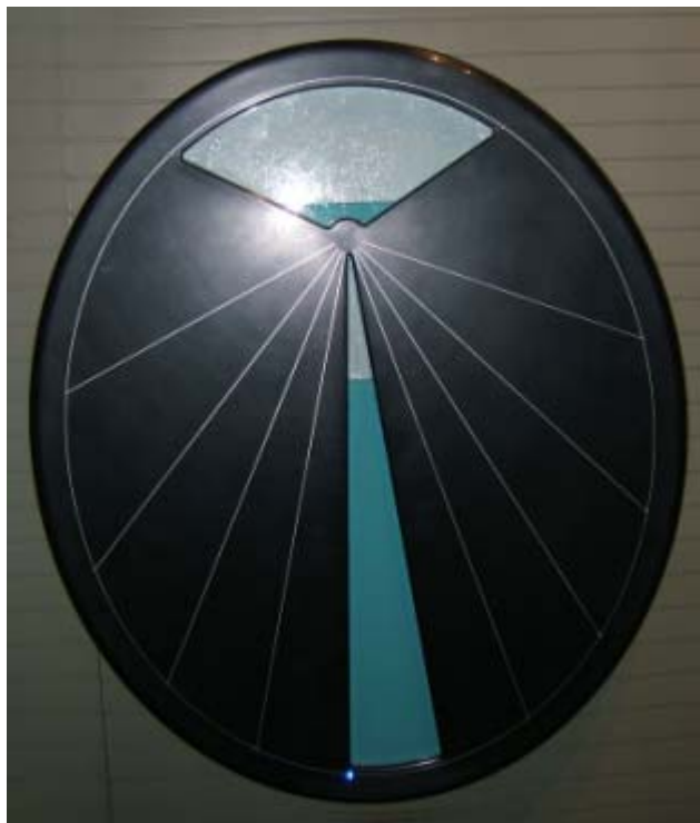
La "loi des aires" (Cité de l'Espace à Toulouse)

L'utilisation du tableur REGRESSI permet d'établir la loi de Kepler, de rechercher une relation simple entre les grandeurs T et R par tâtonnement, (modélisation et détermination de la constante pour la loi de Kepler T^2/R^3 = \text{cte} ).